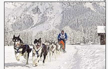
Schlittenhunde vor Traumkulisse